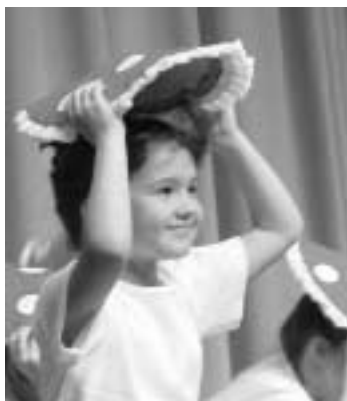
Auftritt der internationalen Kindertanzgruppe aus Mayen.

„Wir sind stolz auf die 101 Mitarbeiterinnen und Mitarbeiter der Caritas, die in der ambulanten Krankenpflege, in den hauswirtschaftlichen, ergänzenden, beratenden Diensten sowie der Familienpflege Vorbildliches