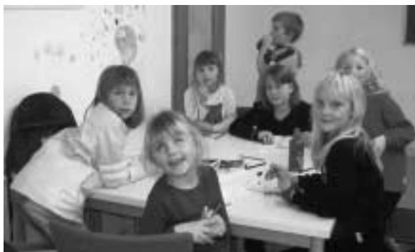
Bei jedem Wetter hatten die Kinder Spaß im Bischof-Bernhard-Stein-Haus.

auch im Jahr 2003 kümmerten sich die Mitarbeiterinnen und Mitarbeiter der Caritasgeschäftsstelle Andernach um alte, kranke und bedürftige Menschen. Aber das ist nur eine Seite der Medaille. Auf der anderen Seite helfen wir auch Menschen, die voll im Leben stehen. Unsere Bildungsfreizeiten, im Sommer 2003 in Bad Meinberg und im Herbst in Bischofsreut, brachten der älteren Generation eine willkommene Abwechslung.