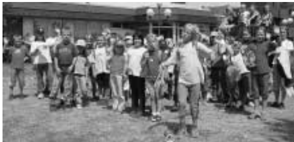
Der Wandertag führte 2003 die Mädchen und Jungen aus Münstermaifeld zur Maifeld-Halle nach Polch.

Die Anfänge der Kinderstadtranderholung reichen in Mayen zurück bis in die Zeit kurz nach dem Ersten Weltkrieg. Damals versorgten Caritas-Schwester in der sogenannten „Milchküche“ Kleinkinder aus Mayen täglich mit einer warmen Mahlzeit und Frischmilch. Über das 20. Jahrhundert hinaus hat die Caritas Mayen das Wohl der jüngeren Generation im Blick, und insofern ist die „Milchküche“ Vorläufer der Kinderstadtranderholung.