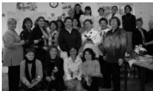
Der vorläufig letzte Kurs des Berufsintegrationsprojektes (BIP) feierte im Oktober 2003 seinen Abschluss.

Banales und Tragisches verbindet sich mit dem Jahr 2003. Es war das Jahr, in dem das Dosenpfand eingeführt wurde, Deutschland den Superstar suchte, die Krankheit SARS ganz Asien lähmte und der Irakkrieg begann. Von diesem Jahr sprechen wir also. Und wir wollen schauen, was sich in dieser Zeit in und um die Caritasgeschäftsstelle Mayen ereignet hat.