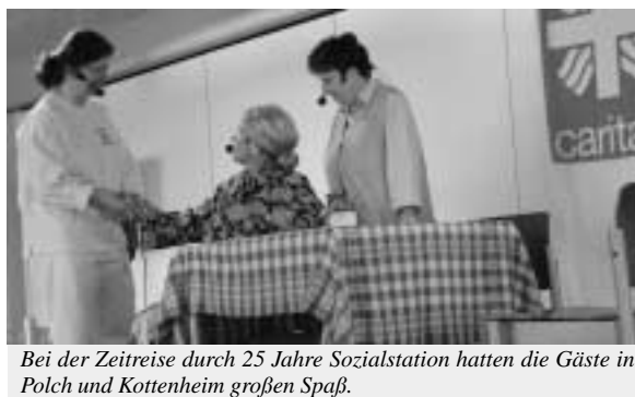
Bei der Zeitreise durch 25 Jahre Sozialstation hatten die Gäste in Polch und Kottenheim großen Spaß.

Im Anschluss segnete Regionaldekan Helmut Schmidt die roten Dienstfahrzeuge der beiden Caritas-Sozialstationen und feierte mit den Gästen und Mitarbeitern einen Festgottesdienst in der Pfarrkirche St. Stephan in Polch.