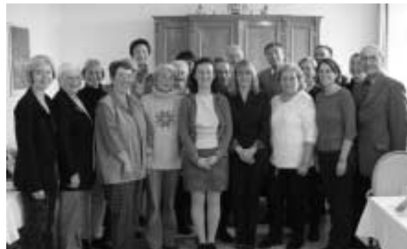
Die Mitglieder des Betreuungsvereins kümmern sich um Menschen, die wie erstarrt sind oder keinen Sinn mehr in ihrem Leben sehen.

Auch der Betreuungsverein der Caritasgeschäftsstelle Andernach konnte am 13. November 2003 in der „Kordel 3“ auf sein zehnjähriges Bestehen zurückblicken. Anfangs (1993) engagierten sich 23