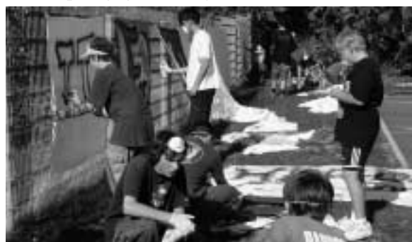
Der Graffiti-Aktionstag in Obermendig wurde dank der Eigeninitiative der Jugendlichen zu einem richtigen Sommerfest.

Auch der Fachdienst Migration hat in 2003 wieder von sich Reden gemacht: Sei es der Spielenachmittag „ohne Grenzen und Sprachbarrieren“ im Freizeitzentrum Mayen oder der Graffiti-Aktionstag der Participatio-Treffpunktarbeit, zu dem 25 Jugendliche auf die Skaterbahn nach Obermendig kamen. Auch das Freizeitpädagogische Projekt MULTI-KULTI-KIDS