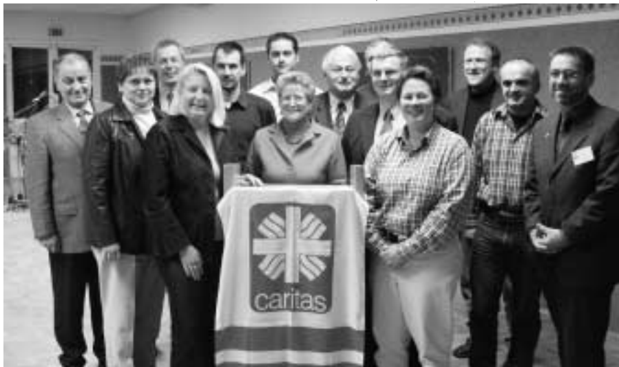
Der neue Rat des Caritasverbandes für die Region Rhein-Mosel-Ahr muss in Zeiten knapper Kassen große Herausforderungen meistern.